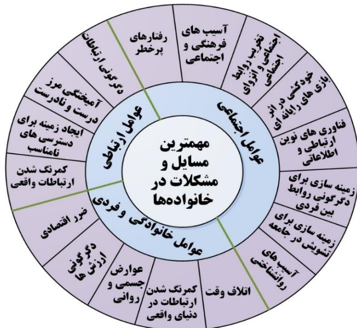
شکل ۱ مدل پژوهش حاصل از بخش کیفی مصاحبه با والدین و متخصصان و مدل پریزم

بر اساس عوامل شناسایی شده فوق مدل مفهومی نهایی پژوهش به قرار زیر است: