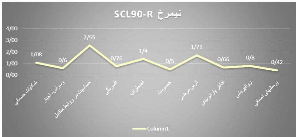
نمودار ۳. نیمرخ روانی آزمودنی در آزمون SCL-90-R قبل از مداخله

در مدت زمان ۱۴ دقیقه، آزمودنی به پرسشنامه SCL-90-R پاسخ داد. نتایج این آزمون با توجه به نمودار ۳، نشان داد که آزمودنی در شکایات جسمانی، اضطراب و ترس مرضی در وضعیت مرضی قرار دارد که خود وی نیز پذیرفت. همچنین، همان‌طور که نیمرخ این آزمون نشان می‌دهد، آزمودنی در حساسیت در روابط متقابل نمره بالایی نسبت به سایر مقیاس‌ها دارد و در حالت بیمار قرار دارد. حساسیت در روابط متقابل به احساس عدم کفایت و حقارت فرد به‌ویژه در هم‌سنجی با دیگران تأکید دارد. دست‌کم گرفتن خود، عدم آرامش، راحت نبودن و ناراحتی محسوس در جریان ارتباط با دیگران، از تظاهرات خاص این بعد است (خدا یاری فرد و پرند، ۱۳۹۱)